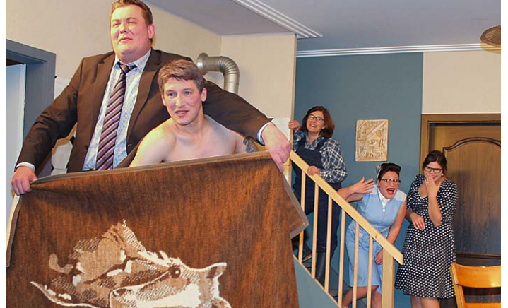
Die Prüderie des Geschäftsmannes sorgt bei den gestandenen Frauen vom Land nur für Gelächter.