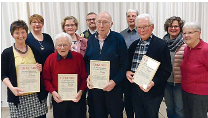
Die geehrten Mitglieder mit den Ehrenurkunden auf der Generalversammlung der Chorgemeinschaft St. Gertrud.