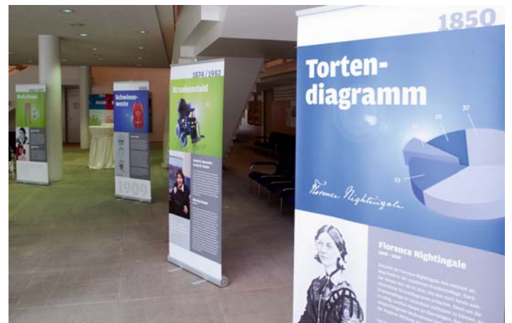
Am 8. März eröffnet um 19 Uhr die Wanderausstellung „Patente Frauen“ im Industrie Museum.