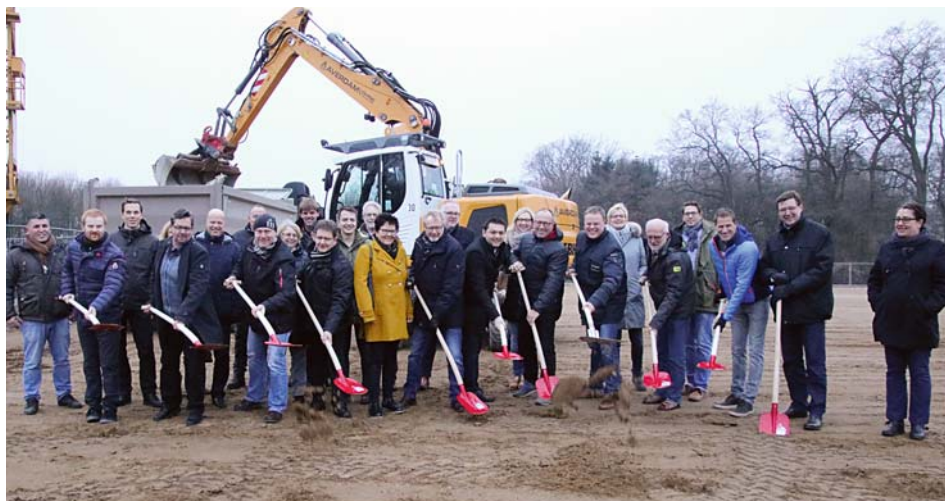
Symbolisch eröffnete bei winterlichem Wetter der Lohner Stadtrat Hand in Hand mit der Verwaltung, den Planern und Handwerkern den Bau der neuen Großsport- und Mehrzweckhalle.

rechtfertige den recht hohen Kostenaufwand von etwa sieben Millionen Euro, neben dem Rathausneubau die größte Gebäudeinvestition in der Geschichte der Stadt. Er ist optimistisch, die Halle - falls das Wetter mitspielt - eventuell schon zu den Lohner Kulturtagen 2018 einweihen zu können.