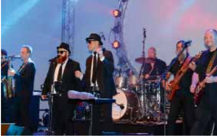
Musik auf verschiedenen Bühnen in der Innenstadt.

Die Besucher des Lohner Stadtfestes können sich auf ein abwechslungsreiches Programm freuen. Am 9. und 10. September 2017 gibt es ein buntes und abwechslungsreiches Programm. Eröffnet wird die 30. Auflage des Cityfestes am Samstagabend, um 18.00 Uhr mit dem „Fest der Kulturen“, im Meyerhof.