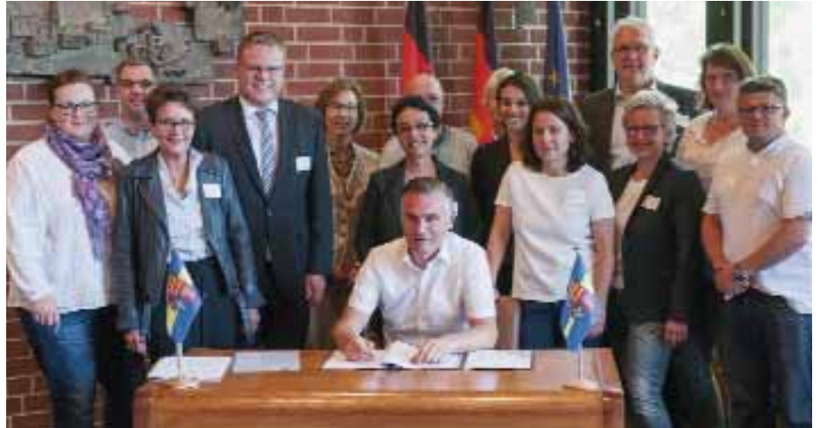
Weitere Unterschriften unter den Lohner Integrationspakt wurden am Montag im Ratssaal gesammelt.

• Weitere Infos unter www.lohne.de/Unsere-Stadt/Praeventionsrat/Integrationspakt.htm