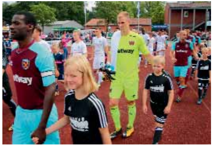
Nicht nur beim Einlauf mit der 3. F-Jugend von GW Brockdorf und den 1. F-Mäd-chen von BW Lohne gaben sich die Profis von Werder und West Ham publikums-nah.

Den Sieg des Vorjahres konnte er jedoch nicht wiederholen. Eine Horde junger Damen, die 1. Fußballmannschaft mit Freundinnen, hatte etwas dagegen. Sie lie-ßen zum 70-jährigen Jubiläum des ausrichtenden SV Schwarz-Weiß Kroge-Eh-rendorf der Konkurrenz vor allem durch einen äußerst gelungenen Schlussak-kord bei der Playback-Show keine Chance, zur Freude des gesamten Dorfes.