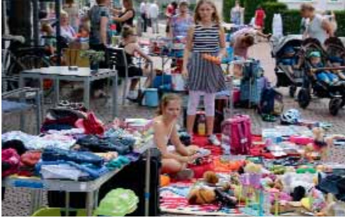
Ein großes und vielfältiges Angebot ist jedes Jahr beim Kinderflohmarkt während der Sommerferien zu finden.

Die Federführung hatte erneut der Stadtjugendring Lohne übernommen und die Anlaufstelle war traditionsgemäß das Büro des Lohner Jugendtreffs, wo auch viele der 184 angebotenen Veranstaltungen ihre Heimat fanden. Das Programm selbst war weitgestreut und wurde dankbar angenommen. Es reichte von sportlichen Aktivitäten über Basteleien jeglicher Art, neue Erfahrungen im