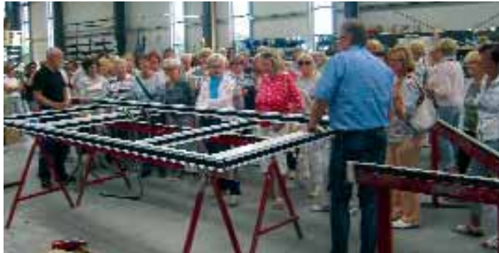
Fahrradtour der Lohner Landfrauen führte nach Dinklage zur Firma Hilgefort & Götting.

80 Lohner Landfrauen fuhren kürzlich über verschlungene Wege nach Brockdorf zur Gaststätte Krimpenfort. Hier erwartete sie ein ausgiebiges Tortenbuffet. Weiter ging die Fahrradtour bei strahlendem Sonnenschein durch den bekannten „Muttentunnel“ nach Dinklage zur Firma Hilgefort & Götting. Bei einer Führung durch die Firma wurde den interessierten Teilnehmerinnen gezeigt, wie Kunststoffenster und Türen hergestellt werden. Zum Abschluß der Fahrradtour gab es eine leckere Bratwurst auf dem Dorfplatz „Gingfeld“. Mit Musik und Gesang klang dieser herrliche Abend aus.