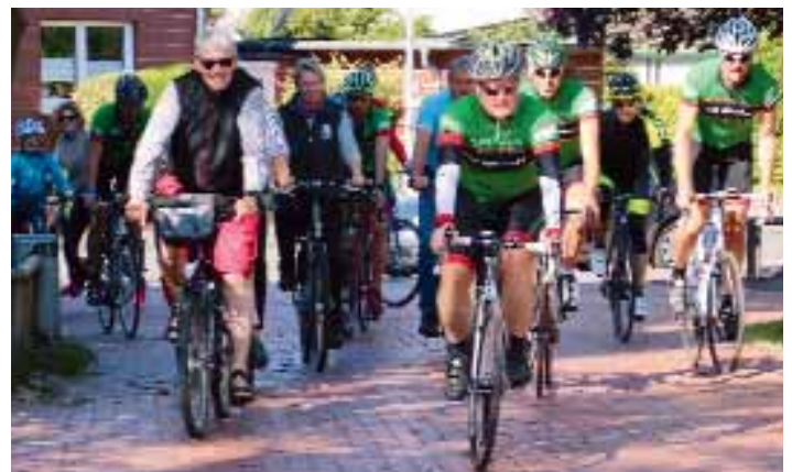
Bunt gemischt ging es im Ziel der Radtourenfahrt der RSG Lohne-Vechta zu.

Ganz gleich ob Trimm- oder Volksradfahrer (108 Teilnehmer), viele nutzten den Tag, um ihr Fitnesserlebnis zu einem kleinen Gruppenereignis zu machen, in der Familie, im Nachbarschafts- oder Freundeskreis. Fachgesimpelt wurde natürlich im Start- und Zielbereich an der Kettlerschule bei den Leckereien, die die RSG vorbereitet hatte.