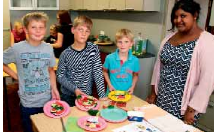
Diese Gruppe präsentiert ihr „gesundes Frühstück“, das dann natürlich gemeinsam verzehrt wird.

Nicht zu zählen ist die Zahl der ehrenamtlichen Helferinnen und Helfer, die sich jedes Jahr einbringen, sei es aus Vereinen, Verbänden, Institutionen, Zusammenschlüssen oder gar Betrieben und Unternehmen. Diese reichhaltige Palette animiert nicht nur viele zum Mitmachen, sondern stärkt auch den Teamgeist und Zusammenhalt in den veranstaltenden Gruppen. Da ist es kein Wunder, wenn es immer leuchtende und dankbare Kinderaugen gibt und nur sehr wenige Veranstaltungen am Ende aus unterschiedlichen Gründen nicht stattfinden können.