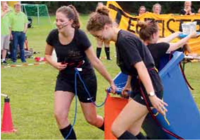
Vor den Sieg haben die Götter den Schweiß gesetzt. Die späteren Siegerinnen der Fußballdamen beim Kampf mit den Altpapier-tonnen, angefeuert vom eigenen Team (hinten links), bestaunt vom Vorjahressieger (in grünen Hemden), dem Mühlener Schützen-thron 2016/17.