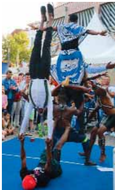
„Fest der Kulturen“ Samstag auf der Volksbank-Bühne im Meyerhof.

Die Kaffeetafel hat Tradition beim Stadtfest. In diesem Jahr tischen die Landfrauen jedoch erstmals am Markt auf und nicht mehr in der Lindenstraße. Dort wie auch auf dem Rixheimer Platz sowie am Markt präsentieren sich alte Schätzchen: Oldtimer und Landmaschinen aus vergangenen Tagen. Die Vereine laden derweil zu Aktionen. Leckereien und Shows, die Händler zum Einkaufsbummel. Und in der Keetstraße gibt es einen Mitmach-Zirkus für Kinder.