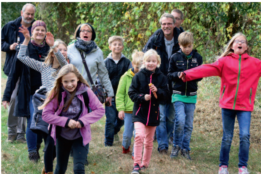
Volkswandertag in Brockdorf, am 08. Oktober 2017.

Auch in diesem Jahr ist der Brockdorfer Volkswandertag somit wieder ein Highlight für alle Wander- aber auch Heimatfreunde. Das Startgeld von zwei Euro pro Erwachsenen sowie einem Euro pro Kind (ab 6 Jahren) kommt der Jugendarbeit des Sportvereins GW Brockdorf zu Gute. Die Brockdorfer Jedermänner hoffen auf eine große Beteiligung und freuen sich darauf, viele Freunde des Volkswandertags wieder zu sehen, aber auch neue Wanderfreunde zu treffen, egal bei welchem Wetter.