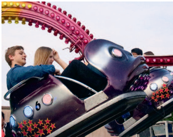
Die Fahrgeschäfte drehen sich in diesem Jahr wieder auf dem Raiffeisenplatz.

Ein Hinweis für alle Autofahrer: Während der Frühjahrsmarkt-Tage sind der Raiffeisenplatz, die Küstermeyerstraße sowie die obere Keetstraße und der Neue Markt für den Autoverkehr gesperrt. Ausweichparkplätze stehen rund um die Fußgängerzone ausreichend zur Verfügung.