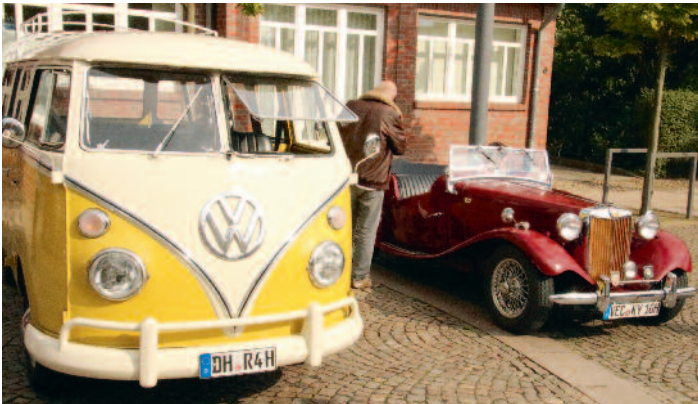
Hingucker bei der Oldtimer-Ausstellung auf dem Lohner Stadtfest.

Wer erteilt Spanisch-Nachhilfeunterricht für einen Mittelstufen-Schüler in Lohne. Tel. 04442/3549 oder 0172/8119763