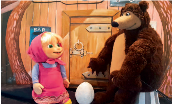
Mascha und der Bär am 28. Oktober 2017 in Lohne.

In einer liebevollen Inszenierung zeigt „Das Bilderbuchtheater“ diese für Kinder sehr lehrreiche Geschichte, die auf einem alten russischen Märchen basiert.