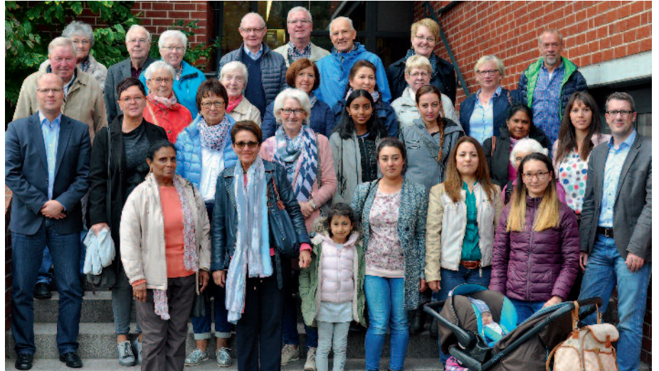
Rund 30 Ehrenamtliche nahmen auf Einladung der Stadt Lohne an der Fahrt nach Mühlen teil.