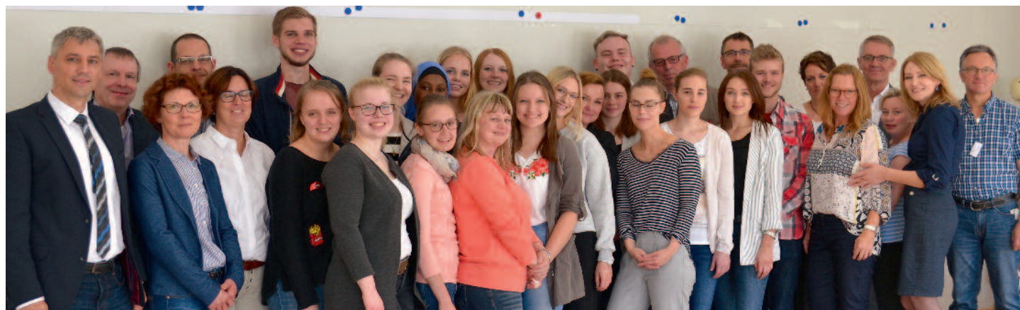
Absolventen der Krankenpflegeschule, Pädagogen, Praxisanleiter, Prüfungsausschuss, sowie Verantwortungsträger des St. Franziskus-Hospitals, Lohne.

Geschäftsführer Meyer wünschte den Absolventen/-innen „alles Gute auf ihren beruflichen Weg für die Zukunft“, sie hätten es sprichwörtlich selbst in der Hand. „Seien Sie immer mutig und nutzen Sie ihre beruflichen Chancen.“