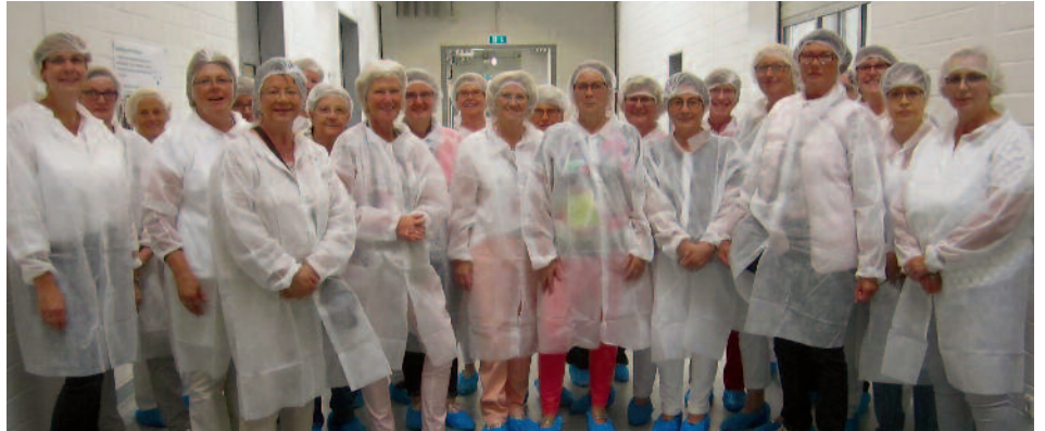
Die Lohner Landfrauen besuchten das „Deutsche Institut für Lebensmitteltechnik e.V.“.

Am 15. Oktober 2017, Stegemann-Schule Lohne, Eingang Falkenbergstraße, in der Zeit von 11.00 bis 15.00 Uhr.