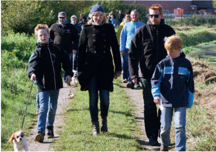
Der 31. Volkswandertag in Brockdorf findet am 14. Oktober 2018 statt.

Am Sonntag, dem 14. Oktober 2018 laden die Jedermänner des SV GW Brockdorf alle Wanderbegeisterten und Heimatfreunde zur mittlerweile 31. Auflage des Volkswandertages ein. Zwischen 13.00 und 15.00 Uhr geht es ab dem Saaleingang der Gaststätte Kalvelage los. Das Startgeld von zwei Euro pro Erwachsenen sowie einem Euro pro Kind (ab 6 Jahren) kommt der Jugendarbeit des SV GW Brockdorf zu Gute. Die Brockdorfer Jedermänner haben wie immer eine abwechslungsreiche und attraktive Rundstrecke mit Zwischenstation und Gewinnspielen ausgearbeitet und hoffen auf eine große Beteiligung. Im Ziel können sich die Wanderer dann mit Kaffee und Kuchen, gekühlten Getränken sowie Imbisspezialitäten stärken. Dort kann auch eine Foto-CD vom diesjährigen Zeltlager erworben werden. Um 17.30 Uhr findet dann eine Verlosung statt, an der alle Teilnehmer automatisch teilnehmen.