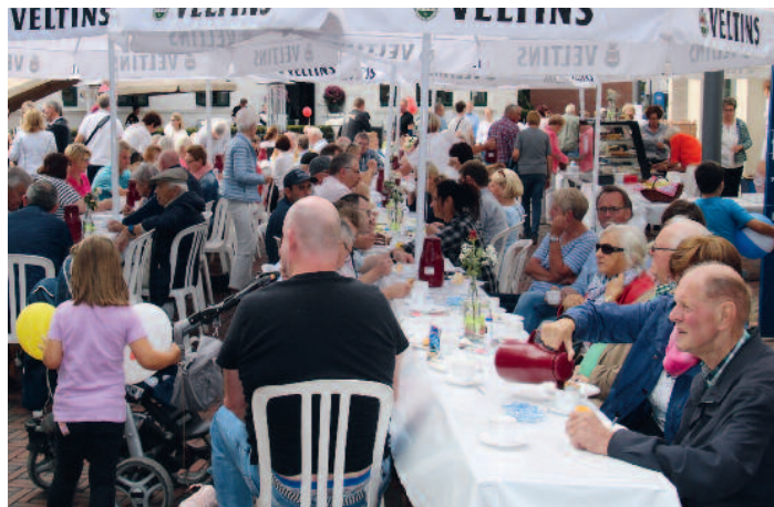
Die große Kaffeetafel in der Fußgängerzone.