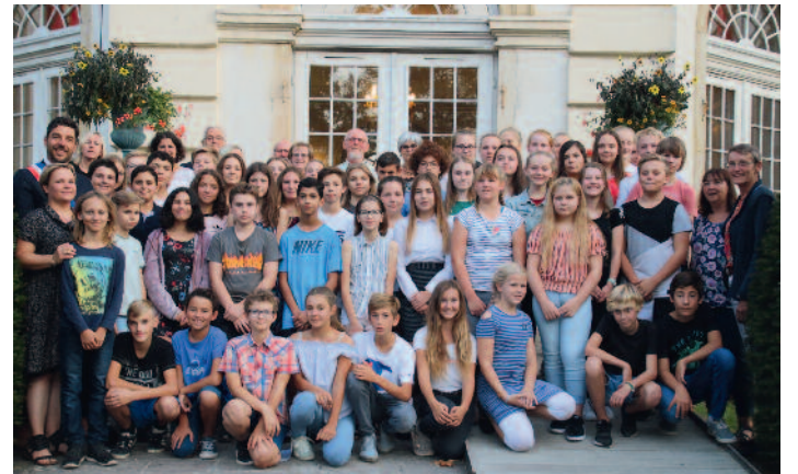
Der Garteneingang zur historischen Kommanderie in Rixheim eignet sich bestens für ein Erinnerungsfoto anlässlich des beginnenden 30. Jahres Schüleraustausch zwischen dem Collège Capitaine Dreyfus und der Realschule Lohne.