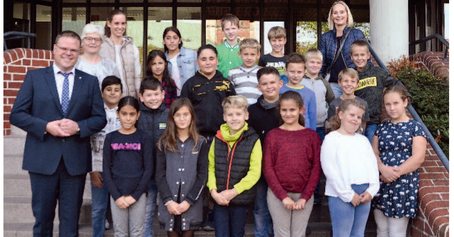
Zu Gast im Rathaus: die vierte Klasse der Grundschule Brockdorf.