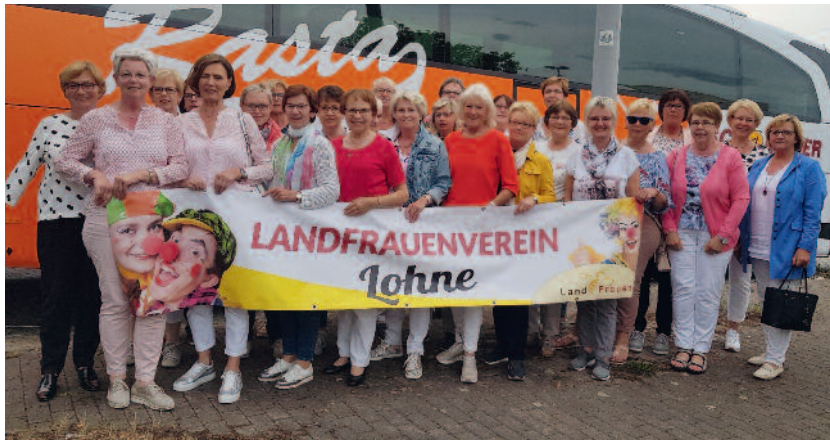
Lohner Landfrauen besuchten Mainz.

Mainz war das 3-tägige Ziel der teilnehmenden Landfrauen. Hier besuchten sie zunächst das große traditionelle Mainzer Weinfest, mit seiner einzigartigen Atmosphäre im Stadtpark und Rosengarten. Nach der Führung durch die Altstadt mit ihren Fachwerkhäusern und mittelalterlichen Marktplätzen und einem Besuch im Mainzer Dom, schauten sie sich auch im Botanischen Garten um. Der Botanische Garten der Johannes Gutenberg-Universität wurde in den Jahren 1946 bis 1955 auf einem Gelände angelegt, das zuvor eine landwirtschaftliche Nutzfläche mit Obstbäumen und ein militärisches Übungsgelände war. Zum Abschluss stand der Besuch des ZDF-Fernsehgartens auf dem Programm. Die Unterhaltungssendung wird live vom Gelände des ZDF-Sendezentrums in Mainz-Lerchenberg übertragen.