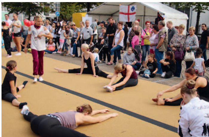
Vereine und Gruppierungen präsentierten sich auf dem Lohner Stadtfest.