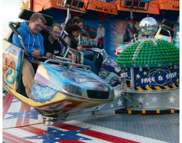
Herbstmarkt-Rummel auf dem Raiffeisenplatz.

Die Karussells auf dem Raiffeisenplatz drehen sich ab Freitagnachmittag (12. Oktober). Um 14.00 Uhr öffnen die Imbiss- und Losbuden, Fahrgeschäfte und viele weitere Attraktionen. Für die jungen Besucher heißt es dann: Das volle Vergnügen zu günstigen Preisen. Denn im Vorfeld des Marktes erhalten die Lohner Grundschüler sowie die Kindergartenkinder den Bummelpass der Schausteller. Der offizielle Start samt Freibier-Ausschank findet am Freitagabend (12. Oktober) um 18.00 Uhr auf dem Raiffeisenplatz statt. Vereine, Firmen, Nachbarschaften oder sonstige Freundeskreise sind dazu herzlich eingeladen. Die Stadtkapelle Lohne sorgt zur Eröffnung für die Musik.