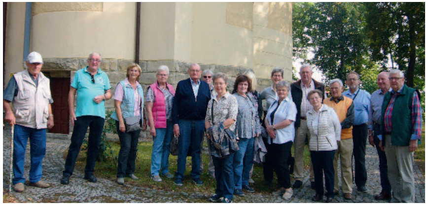
Teilnehmer der BdV Reisegruppe vor der Kirche Altheide.

Am nächsten Morgen fuhren wir in die Kreisstadt nach Glatz, die in der Mitte des Glatzer Kessels