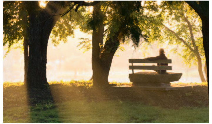
Mehr als sonst richten sich im Trauermonat November die Gedanken auf das Ende des Lebens.

Die Erinnerungskristalle und Gedenkskulpturen werden von zwei Schweizer Glas-künstlern einzeln in Handarbeit gefertigt. Die Formen lassen den Blick auf die eingeschmolzene Kremationsasche frei, die Asche ist dabei ein unauffälliger Bestandteil der Figur. In Zusammenarbeit mit dem Anbieter können auch individuelle Skulpturen entsprechend persönlicher Wünsche entworfen werden. Seit Neuestem bieten die Schweizer auch ein sogenanntes DNA-Banking an. Die DNA eines Menschen enthält wertvolle Informationen über die gesundheitlichen Risiken einer Familie und über deren Abstammung. Mit dem Eintritt des Todes beginnt sich die Qualität dieser im Körper befindlichen und in der DNA kodierten Informationen kontinuierlich zu verschlechtern - nach der Beerdigung sind sie praktisch verloren. Die Lösung ist das DNA-Banking: Der Bestatter entnimmt die DNA-Probe des Verstorbenen vor der Kremation oder Beerdigung und schickt sie in die Schweiz. Die DNA wird anschließend von einem Labor extrahiert, gereinigt und in einer speziellen Kapsel gesichert an die Angehörigen zurückgeschickt.