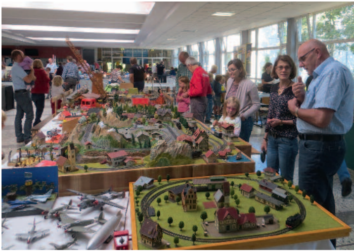
Modellbau- und Eisenbahnausstellung im Lohner Gymnasium am 27. und 28. Oktober.