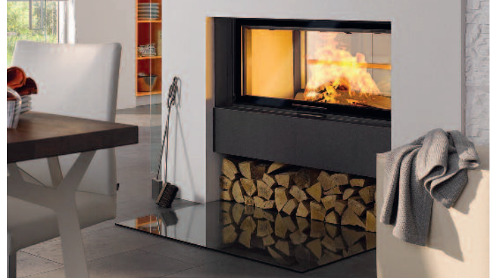
Heizen mit Holz steht für Unabhängigkeit, Behaglichkeit und ein besonders gutes Raumklima.

Das Angebot an modernen Holzfeuerstätten ist in Sachen Design und Form groß. Das gilt vor allem für handwerklich gefertigte Kachelöfen und Kamine. Dabei sollte man auf die Kompetenz eines Ofen- und Luftheizungsbauers setzen. Gerade bei Effizienzhäusern kommt es besonders auf die richtige Dimensionierung der Einzelfeuerstätte, die Luft-/Abgasführung und die optimale Vernetzung mit anderen Energieerzeugern an. Der Experte sorgt auch dafür, dass gesetzliche Bestimmungen sowie Vorgaben des Baurechts und des Umweltschutzes eingehalten werden.