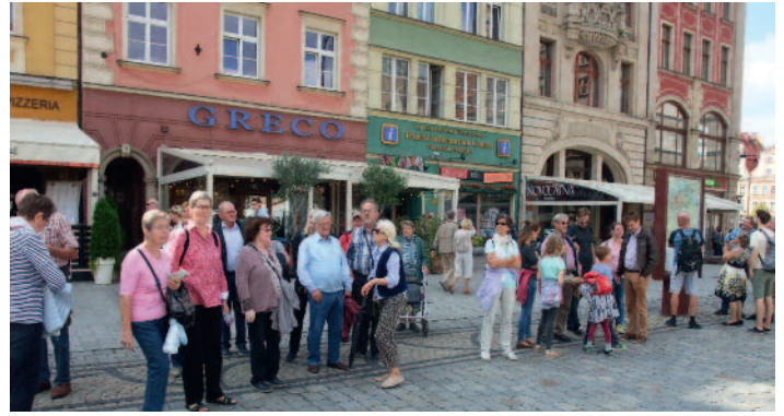
Teilnehmer der BdV Reisegruppe auf dem Ring in Breslau.

Am nächsten Morgen besichtigten wir den Ring mit den wunderbaren mittelalterlichen und barocken Häusern, ebenso der Salzmarkt und das Rathaus in der Mitte des Rings. Es zählt zu den großen Kostbarkeiten der deutschen profanen Gotik und Renaissance. Die Südfassade mit reich geschmückten Erkern und Friesen, entstand im 15. Jh., an der Südseite beherbergt das Rathaus den bekannten Schweidnitzer Keller. Der Ring war nach dem Krieg 1945 stark zerstört, wurde jedoch nach alten deutschen Bauplänen wieder rekonstru-