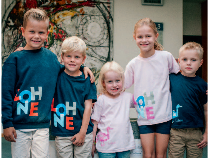
Können sich sehen lassen: die neuen Kinder-Textilien aus der Lohne-Kollektion. Sie gibt es im Rathaus, im Industrie Museum und bei Toys & Co. Römänn.