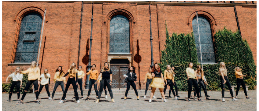
Die Tänzer der Gruppe „Selected“ vor der Pfarrkirche St. Gertrud.

zaubern. Der Kirchenraum wird bei diesem Auftritt durch Lichtinstallationen stimmungsvoll illuminiert. Zu diesem außergewöhnlichen Konzert mit Tanz lädt die Pfarrgemeinde St. Gertrud im Jubiläumsjahr herzlich ein. Der Eintritt ist frei - um Spenden wird gebeten. Internet: www.stage7-lohne.de