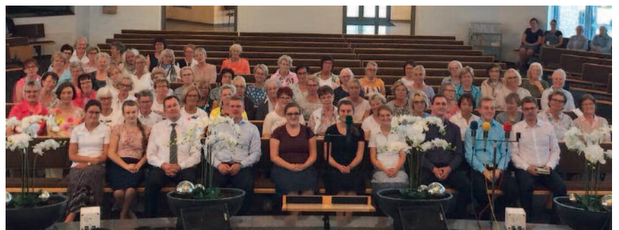
Lohner Landfrauen im Bethaus in Badbergen.

in großen Teilen dort ab. Der gemütliche Teil am Abend fand dann auf dem „Artlandhof und Heuhotel“ der Familie Hillebrand, An der Burenstroaten, statt.