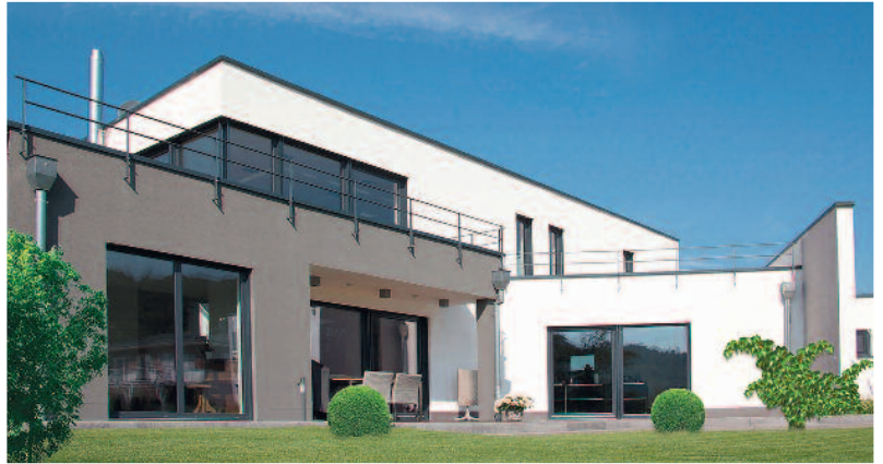
Schon beim Bau auf die Wohngesundheit achten: Ein Mauerwerk aus Leichtbeton trägt zu einem gesunden und konstanten Raumklima bei.

Die feuchtigkeitsregulierende Eigenschaft des Leichtbeton-Mauerwerks trägt maßgeblich zu einer ausgewogenen Raumlüftung bei. Vor allem in modernen, nahezu luftdichten Niedrigenergiehäusern wird so ein konstantes Wohnklima unter-