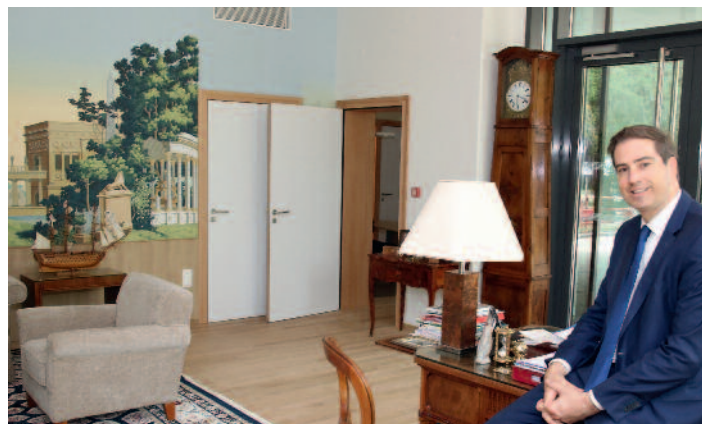
Nationalversammlungs-Abgeordneter Olivier Becht hat ein modernes Bürgerbüro im „Annexe“ der Rixheimer Kommanderie bezogen, für das er monatlich 1080 € Miete an die Stadt überweist.