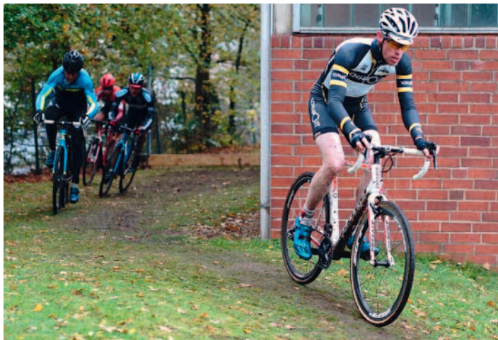
Am 21. Oktober 2018 wieder „Rund um den Lohner Aussichtsturm“.

In verschiedenen Altersklassen ab Jahrgang 2004 und jünger geht es für die