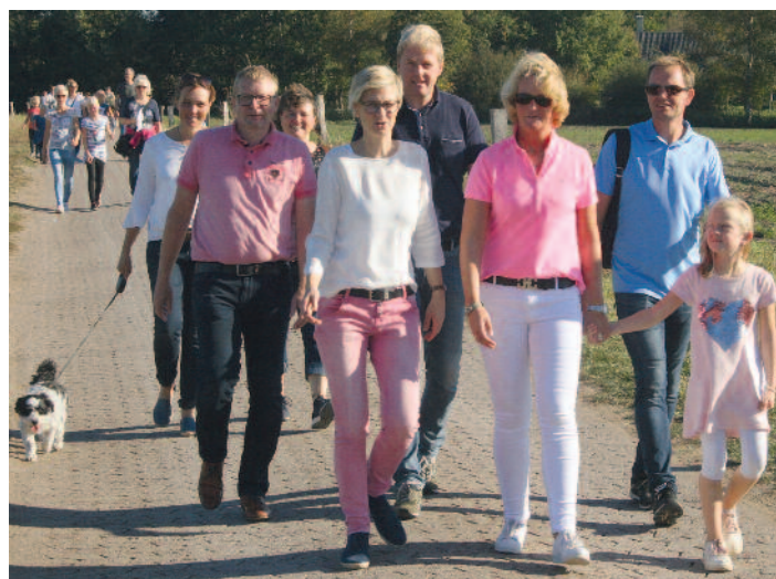
Am 13. Oktober 2019 findet in Brockdorf der 32. Volkswandertag statt.

Somit ist der Volkswandertag wieder ein Highlight für alle Wander- aber auch Heimatfreunde. Das Startgeld von zwei Euro pro Erwachsenen sowie einem Euro pro Kind (ab 6 Jahren) kommt der Jugendarbeit des SV GW Brockdorf zu Gute. Die Brockdorfer Jedermänner hoffen auf eine große Beteiligung und freuen sich darauf, viele Freunde des Volkswandertags wieder zu sehen, aber auch neue Wanderfreunde zu treffen - egal bei welchem Wetter!