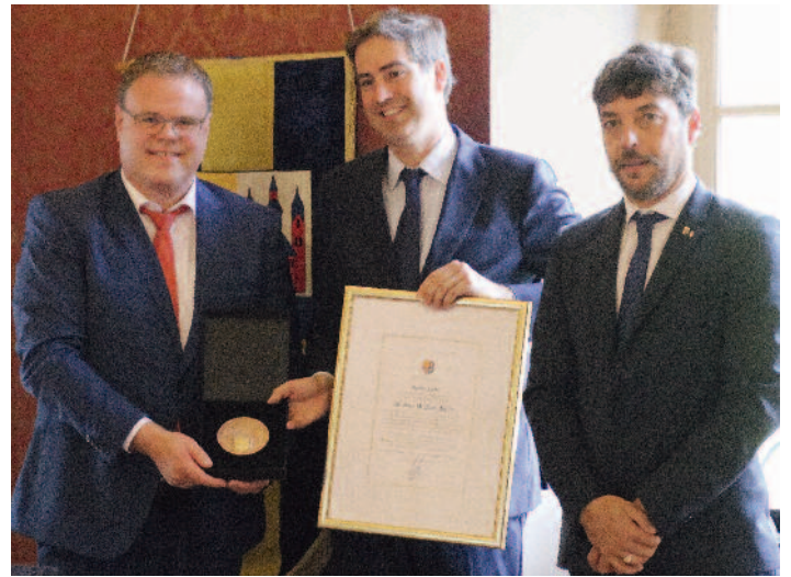
Bürgermeister Tobias Gerdesmeyer ehrte seinen ehemaligen Amtskollegen Olivier Becht (heute Abgeordneter der Nationalversammlung) mit der Goldenen Stadtmedaille. Erster Gratulant war Rixheims Bürgermeister Ludovic Hays.