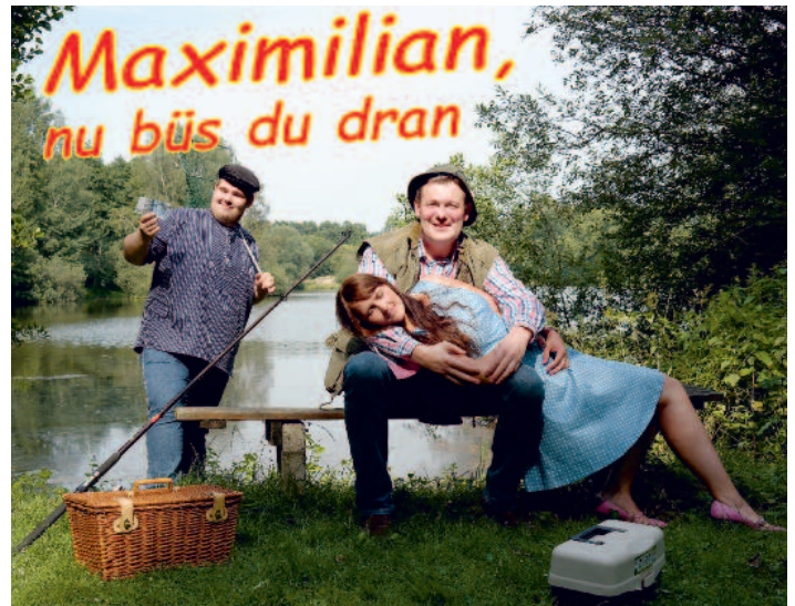
Am 1. Februar 2020 ist in Bokern-Märschendorf Premiere von „Maximilian, nu büs du dran“.

Infos unter www.schuetzenverein-bokern-maerschendorf.de