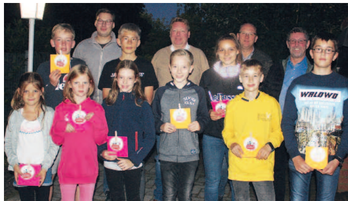
Gewinnauslosung vom Spielernachmittag des Lohner Schützenfestes.

Im Anschluss fand ein gemeinsames Essen, dass keine Wünsche offen lies, statt. Alle Kinder fanden noch viel Zeit, sich auf dem nahegelegenen Spielplatz der Dorfgemeinschaft Südlohne, auszutoben. Dieses ermöglichte den Erwachsenen einige Termine und diverse andere Gespräche untereinander auszutauschen. Der Kennlernabend, so alle beteiligten, sollte ein fester Bestandteil für die Zukunft bleiben.