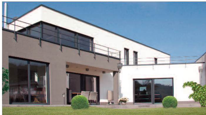
Hochwertig, langlebig und dazu noch mit positiver Ökobilanz bauen: Das Baumaterial Leichtbeton verbindet zahlreiche Vorteile miteinander.

Entscheiden sich private Bauherren beispielsweise für ein Mauerwerk aus solidem Leichtbeton, profitieren sie von dessen natürlicher Beschaffenheit sowie der ressourcenschonenden Produktion. Die Herstellung von Leichtbetonsteinen punktet mit einem niedrigen Primärenergiebedarf und geringem Treibhauspotenzial. Denn Leichtbeton muss keinen Brennprozess durchlaufen, sondern härtet in sogenannten Trockenregallagern an der Luft aus. Die damit bereits gute Ökobilanz verbessert etwa der Hersteller KLB aus Andernach in Rheinland-Pfalz aufgrund seines Unternehmensstandortes: Der benötigte Rohstoff Bims wird im nahe gelegenen Neuwieder Becken abgetragen, sodass nur kurze Transportwege entstehen. Dabei findet der Abbau des natürlichen Vulkangesteins ausschließlich an den Stellen statt, an denen eine zeitnahe Rekultivierung gewährleistet ist. Vorteilhaft für Bauherren: Aufgrund der sehr guten Wärmedämmeigenschaften des fertigen Baustoffes werden dauerhaft Heizkosten eingespart - die Montage kostspieliger Außendämmungen ist nicht nötig.