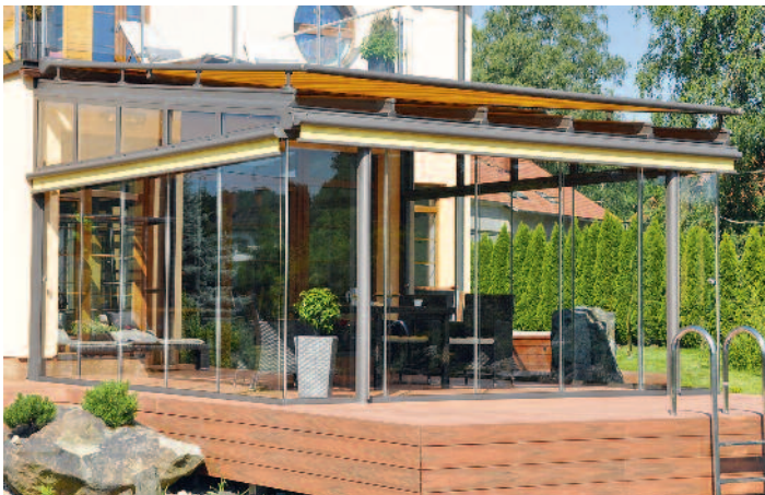
Eine Rundum-Verglasung macht die Terrasse fast das ganze Jahr über nutzbar.

(djd). Outdoor-Feeling an kühleren Tagen, Wohnraum-Erweiterung, Orangerie für frostempfindliche Pflanzen: Für den Anbau eines Wintergartens am Eigenheim gibt es viele gute Gründe. Dabei sind sogenannte Kaltwintergärten wie die Glasoase von Weinoor günstiger als Warmwintergärten, deren energetische Ausstattung gesetzlichen Vorgaben genügen muss. Sie bieten Wetterschutz ab dem zeitigen Frühjahr bis weit in den Herbst hinein und können auch an sonnigen Wintertagen gut genutzt werden. Mehr Infos und Tipps gibt es unter www.weinoor.de . Bei der Planung sollte man ein paar Punkte beachten: Verschiebbare Glaselemente machen den Bereich flexibel nutzbar, ein textiler Sonnenschutz verhindert Überhitzungen nicht nur im Sommer und eine gute Ergänzung sind integrierte Leuchten und Heizelemente.