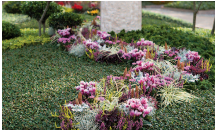
Das Alpenveilchen sorgt mit Farbvariationen von weiß bis pink für farbenfrohe Akzente auf dem Friedhof.

Wer wissen möchte, wie man das Alpenveilchen als Grabpflanzung ideal einsetzt, sollte sich bei qualifizierten Friedhofsgärtnern und Friedhofsgärtnerinnen erkundigen. Mehr Informationen gibt es unter www.grabpflege.de . Die Experten und Expertinnen für schöne Gräber stehen ihren Auftraggebern aber auch bei allen anderen Fragen rund um die Grabpflege mit Rat und Tat zur Seite. „Wir wissen, welche Pflanze an welchem Standort optimal blüht, wie man sie perfekt kombiniert und welche Pflege sie benötigt“, erläutert Birgit Ehlers-Ascherfeld. Friedhofsgärtner bieten im Übrigen neben der Beratung auch viele verschiedene Serviceleistungen an. Sie gestalten die Gräber, gießen die Pflanzen, wechseln sie je nach Jahreszeit gegen andere aus, entfernen Unkraut oder decken die Ruhestätte im Winter mit kunstvoll arrangierten Tannenzweigen, Wacholder und Moosstreifen ab. Zu den Totengedenktagen fertigen sie zudem individuelle Grabgestecke und Kränze an.