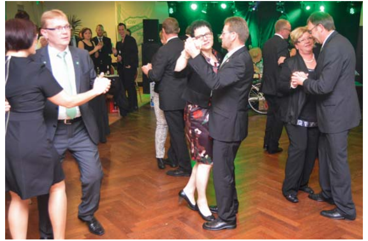
Beim Sportlerball von Grün-Weiß Brockdorf wird bis in die frühen Morgenstunden gefeiert.

Wie immer wird auch der Saal festlich geschmückt sein, sodass sich der Vereinsvorstand sowie Vereinswirtin Edeltraud Kalvelage auf einen tollen Abend und eine magische „Grün-Weiße Nacht“ freuen. Aufgrund der großen Nachfrage in den letzten Jahren, ist eine Tischreservierung bei Edeltraud Kalvelage (04442/3030) zwingend erforderlich. Einlass ist für alle ab 18 Jahren.