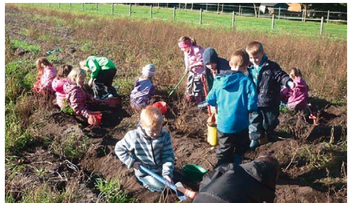
Die Kita-Kinder bei der herbstlichen Kartoffelsuche.

Schmutzig und glücklich nahmen die Jungen und Mädchen die geernteten Kartoffeln mit zur Kita. Dort wurden sie auf verschiedene Weise zubereitet und mit Genuss gegessen; etwas Besonderes war das Kartoffelfeuer mit Eltern und Kindern. Eine besondere Erfahrung war es für die Kinder zu erleben, wo und wie die Kartoffeln wachsen, bevor sie in den Geschäften zu kaufen sind. Die Kinder bedanken sich nochmals bei der Familie Herzog für diesen tollen, erlebnisreichen Tag.