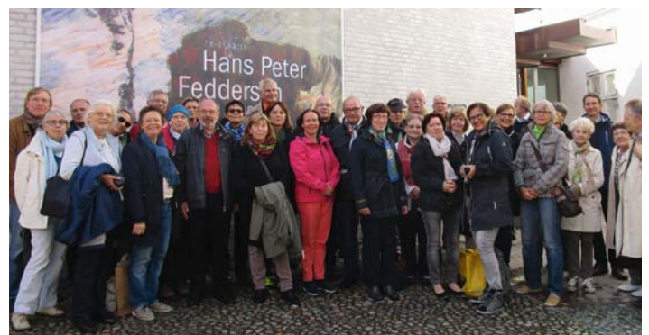
Die Teilnehmer vor dem Museum „Kunst der Westküste“ auf Föhr.