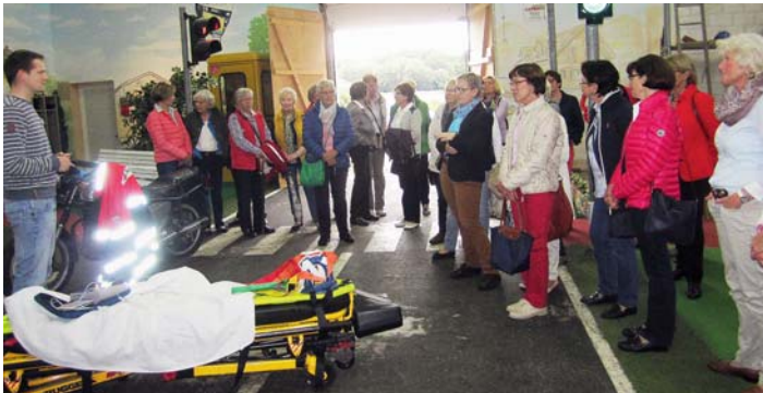
Die Lohnner Landfrauen in der RettArena in Nellinghof.