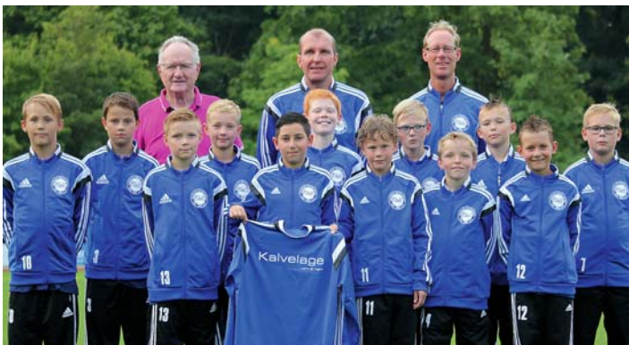
Die 2. D-Jugend des TuS Blau-Weiß Lohne bedankt sich bei der Firma „Kalvelage - Licht und mehr“ für einen neuen Satz Trainingsanzüge und gratuliert zum 50-jährigen Bestehen.