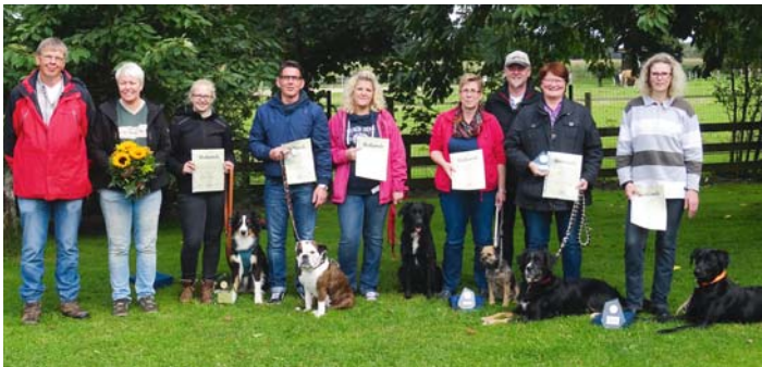
Absolventen der Prüfung zum verkehrssicheren Begleithund beim Hundesportverein Lohne e.V.