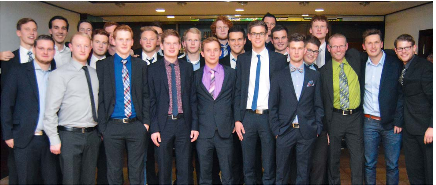
Die Mannschaft des Jahres 2014, die 3. Herren.