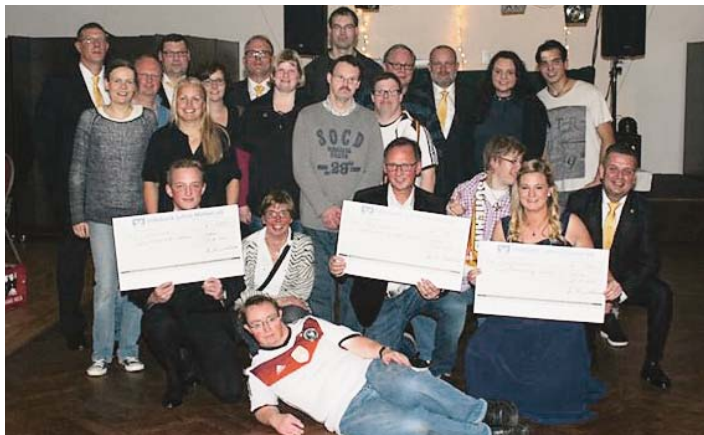
Übergabe der Spenden aus den Einnahmen des Jubiläumsfestes.

Im Anschluss sorgte DJ Heppo für gute Tanzstimmung und so ging ein wunderbares Jubiläumsjahr kameradschaftlich zu Ende. Der Bataillonsvorstand des IV. Bataillons „Südlohne“ bedankt sich bei all seinen Schützenbrüdern und -Schwestern für ein tolles Jahr.