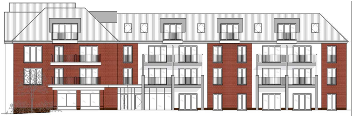
Die rückseitige Ansicht des neuen Wohnparks „Alte Weberei“ an der Langen Straße in Dinklage.