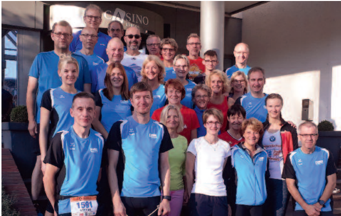
Aufbruch zum 11. Stadtwerke Lübeck Marathon der 30-Teilnehmer starken Waldschleichergruppe, die mit beachtlichen Ergebnissen heimkehrten.

Abgerundet wurde das Wochenende mit einer Bootstour auf der Trave und einer Stadtbesichtigung der alten Hansestadt.