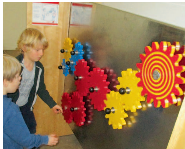
Die kath. Kindertagesstätte St. Gertrud besuchte die Wanderausstellung „Mini-Mathematikum“.

Im Oktober besuchten die Ganztagskinder der kath. Kindertagesstätte St. Gertrud, Marienstraße 23, Lohne die Wanderausstellung „Mini-Mathematikum“ im Lohner Industrie Museum. Das „Mini-Mathematikum“ ist ein besonderer Bereich der Mathematik, der speziell für 4- bis 8-jährige Kinder entwickelt wurde. In vielfältiger Weise wurden Zahlen, Formen und Muster erfahrbar gemacht.