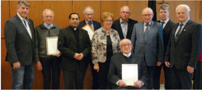
Zahlreiche Ehrungen auf dem Kolpinggedenktag.

Nach dem Rückblick auf vergangene Veranstaltungen wurde besonders auf die kommenden hingewiesen. Die Lohner Kolpingfamilie feierte im vergangenen Jahr ihr 125-jähriges Bestehen. Gleichzeitig feierte die Pfarrkirche St. Gertrud ihr 200-jähriges Bestehen. Die Nikolausaktion ist immer eine große Herausforderung, mit ca. 25 Nikoläusen und insgesamt bis zu 100 Helfern. Der Handwerkerball findet am Samstag, 19. Januar 2019 im Saal Hoyer statt, wozu alle Lohner eingeladen sind. Ebenso zum Doppelkopfturnier am 10. Februar 2019 im Adolf-Kolping-Haus.