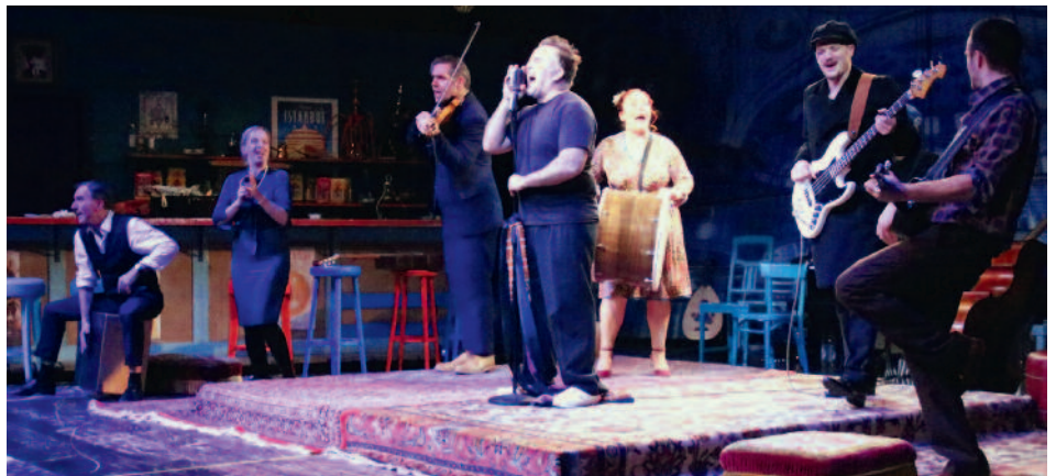
Drama, Singspiel, Musical als das präsentierte das Theater Bremen in der Aula des Gymnasiums mit dem Erfolgstück „Istanbul“, in dem ein Bremer Gastarbeiter in der Türkei seine zweite Heimat findet.

lich nicht zurückgekehrt nach Bremen?“ und fand eine melancholische Antwort in der Lyrik Akkus: „Ach, seitdem Istanbul Istanbul ist, hat es nicht solchen Kummer erleben müssen. Ich krepriere vor deiner Liebe. Es ist keine Spur von Stolz geblieben...“ Die Frage bleibt offen, ob das ebenfalls die in Deutschland gebliebenen türkischen Mitglieder für ihre neue Heimat unterschreiben können.