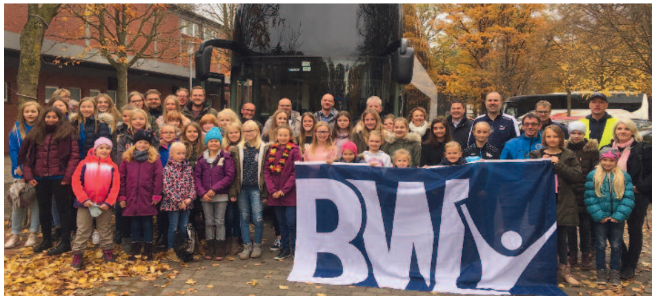
Vor der Abfahrt zum Test-Länderspiel der DFB-Frauen gegen die Frauen-Nationalmannschaft aus Italien nach Osnabrück.

Im Vorfeld wurde bekannt, dass Blau-Weiß Lohne aktuell die zweitgrößte Juniorinnenfußballabteilung Deutschlands stellt und der im Frühjahr durchgeführte „Tag des Mädchenfußballs“ die erfolgreichste Werbeaktion mit 26 Neuanmeldungen in diesem Jahr in Deutschland war!