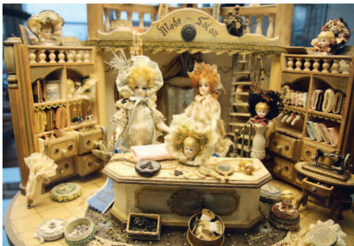
Unzählige kleine Assessoirs prägen den Mini-Modsalon, eines der Prachtstücke der historischen Spielzeugausstellung im Industrie Museum.