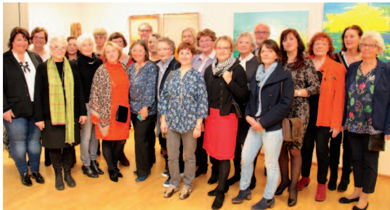
Ein großes Spektrum heimischer Kunst präsentieren 25 Mitglieder des Freundeskreises Luzie Uptmoor in der Ausstellung „Innenansichten III“, die derzeit in der Galerie zu sehen ist.

Der Freundeskreis Luzie Uptmoor hat zum dritten Mal eine Ausstellung eröffnet, in der sich Mitglieder selbst präsentieren können. „Innenansichten III“ präsentiert bis zum 27. Januar in der Galerie über dem Industrie Museum die Werke der 23 Künstlerinnen und zwei Künstlern. Neben Bildern unterschiedlichster Stilrichtungen, Materialien und Techniken haben drei Mitglieder Skulpturen ausgestellt. Die Ausstellung ist zu den Öffnungszeiten des Museums geöffnet. Wer tiefere Einblicke wünscht, kann am 13. Januar und am Finissage-Tag, dem 27. Januar ab 15.00 Uhr mit ausstellenden Künstlerinnen und Künstlern ins Gespräch kommen.