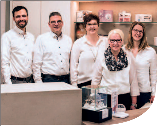
Vechta im Alexanderhaus, Marienstr. 13, Tel. 0 44 41 / 99 29 04