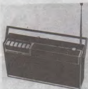
Nordmende 3 Wellen