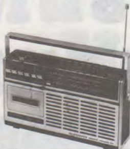
Telefunken Baja 220-