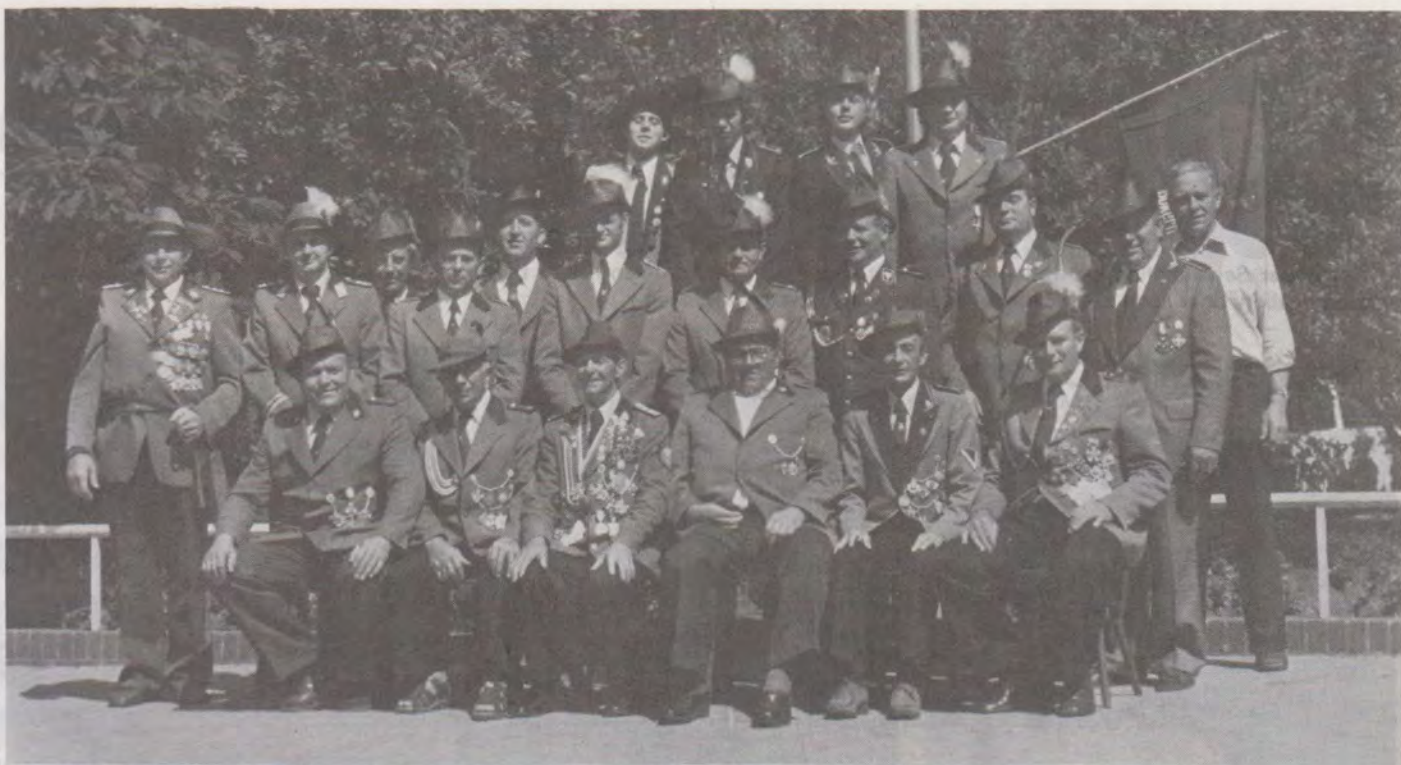
Froschkompanie Bokern im Jubiläumsjahr 1977