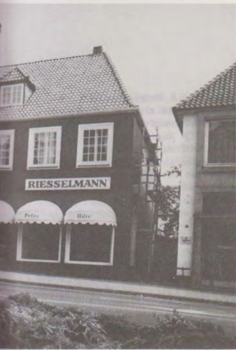
sche/Rießelmann an der Brinkstraße 1