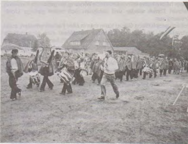
links: Für 99 Pf Eintritt konnte man am Riebel/Gingfeld/Hopen-West/Meyerfelde Dorffest teilnehmen. Es war richtig was los. Auf dem unteren Bild rettet sich der Kinderspielmannzug mit den neuen, vom Schützenverein gestifteten Mützen ins Zelt. Oben: Gerettet!