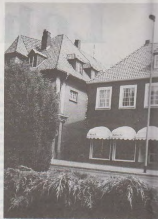
Das neu eröffnete Geschäftshaus Hunsche