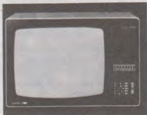
Nordmende 51 cm