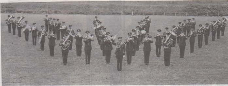
Luftwaffenmusikkorps 3, Munster