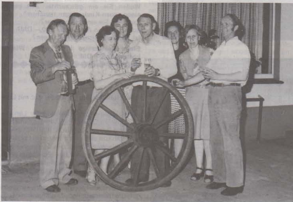
zum Festsaal. (Beide sind natürlich auch Motortradfans!)