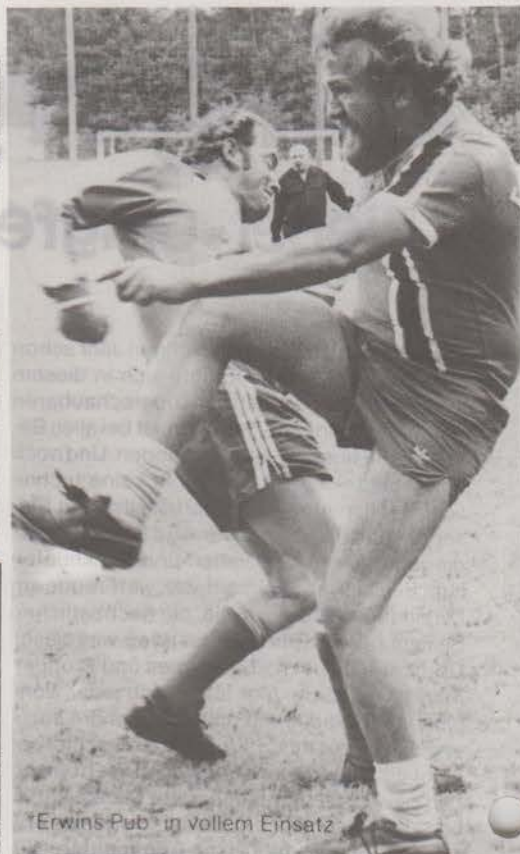
Erwins Pub in vollem Einsatz