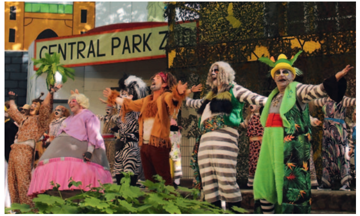
Sichtlich erleichtert und erfreut präsentiert sich das „Madagascar“-Ensemble nach einer äußerst gelungenen Premiere.