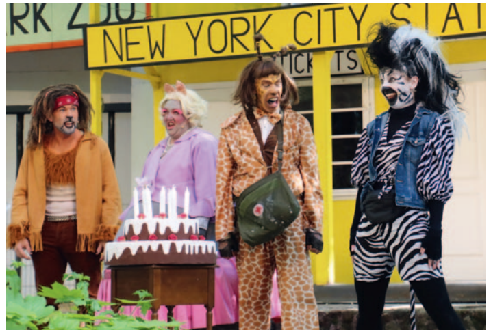
Noch feiern Löwe Alex, Nilpferd-Dame Gloria und Giraffe Melman einträchtig den 10. Geburtstag von Zebra Marty. Aber bald geht es turbulenter zu.