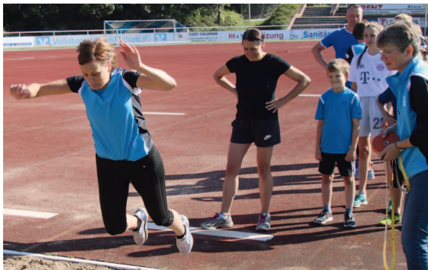
Seit dem 5. Mai laufen, springen, werfen, radeln und schwimmen sie wieder, um am Ende das Deutsche Sportabzeichen in Händen zu halten. Treffpunkt ist jeden Donnerstag das Heinz-Dettmer-Stadion (ab 19.00 Uhr).