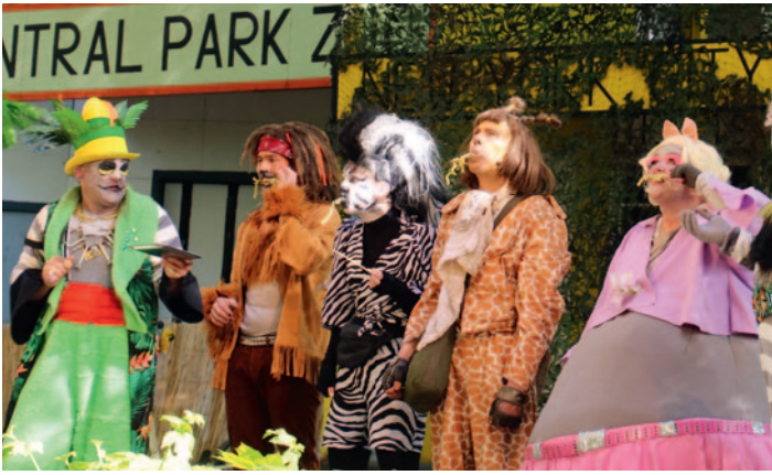
King Julien, der Lemurenchef auf Madagascar, möchte seinen Gästen aus New York natürlich auch etwas Leckerer bieten, doch so ganz trifft er mit den Nudeln nicht den Geschmack.