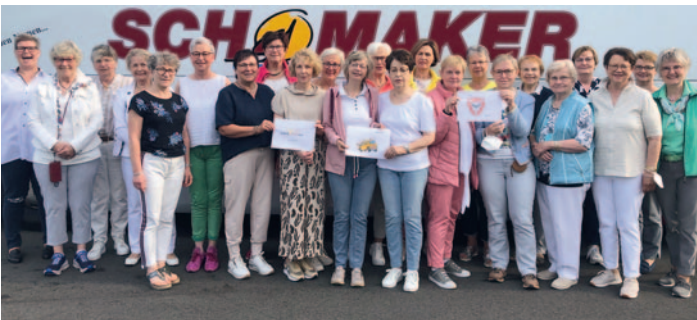
Die Lohner Landfrauen unterwegs in Kiel, Plön und Eutin.

Bevor am 3. Tag die Heimreise angetreten wurde, legte man noch eine Stippvisite in der Hansestadt Lübeck ein. Auf den Spuren der „Buddenbrooks“, ging es für einige Stunden durch die Stadt. Gute Laune und sommerliches Wetter waren für die gesamte Zeit mit im Gepäck. Frohen Mutes traf man am Abend, nach 3 gelungenen Tagen, wieder in der Heimatstadt Lohne ein.