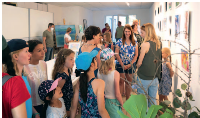
Sommerfest und Kunstausstellung im Atelier Rauschend.

Nach der Ausstellung ist vor der Ausstellung. Ab September nach den Sommerferien wird in der Kunstschule wieder fleißig und freudig gekünstelt. Der Atelierbetrieb fängt wieder mit einem großen Angebot von interessanten Workshops für Kinder und Erwachsene an. Alle Kunstinteressierten sind herzlich willkommen.