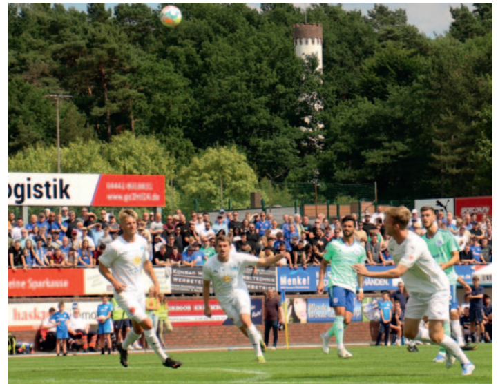
Fast auf Aussichtsturmhöhe stieg der Ball beim Gastspiel des FC Schalke 04 im Heinz-Dettmer-Stadion vor voll besetzten Rängen.

Mit diesem Selbstbewusstsein im Rücken sah es lange nach einem gelungenen Punktspielstart aus. Gegen Phönix Lübeck führte der Regionalliga-Aufsteiger bis sechs Minuten vor dem Ende 2:1, um die Punkte mit 2:3 doch noch herzuschenken. Aber das Team hatte den Nachweis erbracht, in der neuen Liga gut mithalten zu können. Mit der noch zu erwerbenden Kaltschnäuzigkeit wird das Minimalziel „Klassenerhalt“ keine Illusion bleiben.