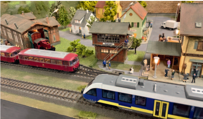
Große Modellbau- und Eisenbahnausstellung im Lohner Gymnasium.

Weitere Informationen zum Verein gibt es unter www.modellbau-freunde-lohne.de