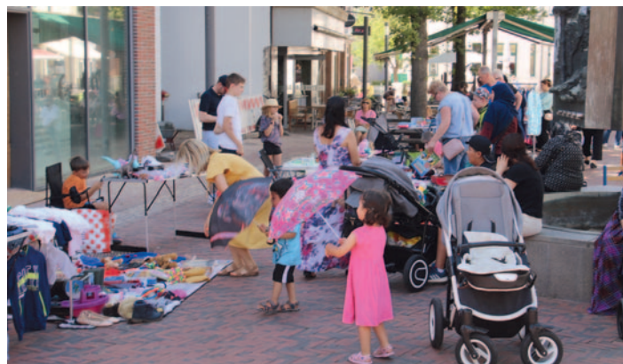
Auf dem „Hinz und Kunz-Flohmarkt von Kindern für Kinder“, der jeden Mittwoch im Rahmen der Ferienaktion stattfindet, ist immer reger Betrieb.

Bis zum 24. August läuft noch das Programm, ehe dann vor allem für die neuen Erstklässler der Übergang an den beiden Folgetagen geprobt wird: „Wir spielen Schule“. Da hat für die „Großen“ das Pauken bereits wieder begonnen.