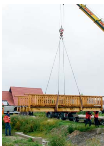
Zentimetergenau setzten die Bauhof-Mitarbeiter die neue Holzbrücke über das Regenrückhaltebecken.

Die acht Meter lange Holzkonstruktion haben die Bauhof-Spezialisten hergestellt. Mit einem großen Kran wurde die Brücke nun zentimetergenau an die richtige Stelle gesetzt. Rundherum legt die Stadt Grünanlagen und Radwege an.