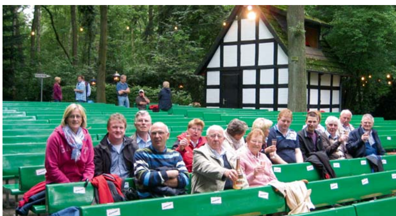
Die Kolpingfamilie St. Josef aus Lohne besuchte die Freilichtbühne in Wagenfeld. Dort besuchten die Lohner die Aufführung des plattdeutschen Stückes „Miene Chefin kommt ut Indien“.