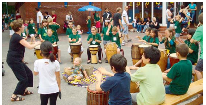
Viel Aktion beim Schulfest in der Gertrudenschule (Foto: Gertrudenschule)

Alle vier Jahre findet an der Gertrudenschule ein großes Schulfest statt. Das diesjährige Schulfest stand unter dem Motto „Wir sind Kinder einer Welt“. Es war ein sehr gelungenes Fest. Die vielfältigen Aktivitäten und Liedbeiträge der Kinder zeigten den Weg in eine Multi-Kulti Schulgemeinschaft. Ein besonderes Highlight war das internationale Buffet, das durch die Eltern gespendet wurde. Der Erlös des Schulfestes wird dem Förderverein der Gertrudenschule zur Verfügung gestellt. Er kommt den geplanten Verschönerungsmaßnahmen für den Pausenhof der Gertrudenschule sowie dem Projekt: „Schulen für Afrika“ von UNICEF zugute.