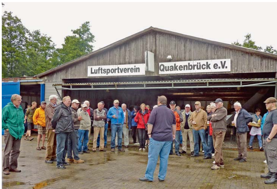
Besuch des Luftsportvereins Quakenbrück