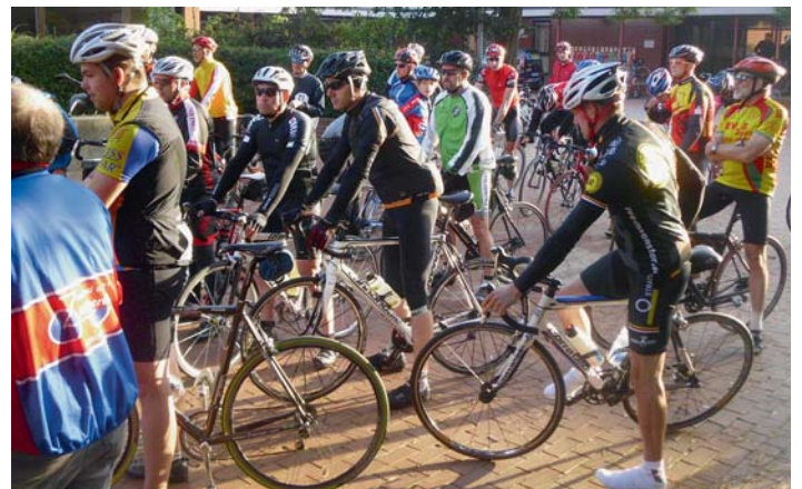
Startvorbereitung der Radrennsportler

Die RSG Lohne-Vechta würde sich freuen viele Teilnehmer am 28. August begrüßen zu dürfen.