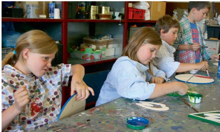
Sag niemand, Mädchen verstehen nichts vom Fußball. Auch die jungen Damen bastelten sich das Wappen ihres Bundesliga-Liebingsvereins.

Am 31. August ist zwar Ferienende, wenn mit dem Italienischen Kochnachmittag die letzte Ferienaktion läuft, doch die 160. Aktivität soll wieder auf den ersten Teil vorbereiten – mit drei „Schulspieltagen“ vom 2. – 5. September.