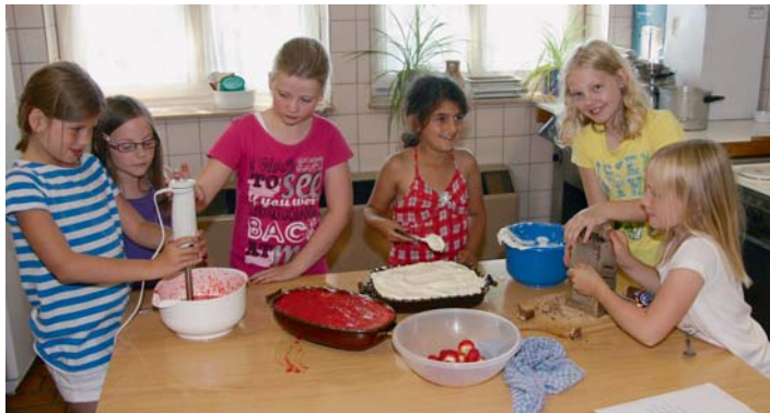
Gerade recht für heißeste Sommertage der ersten Ferienwoche: Kaltspeisen.