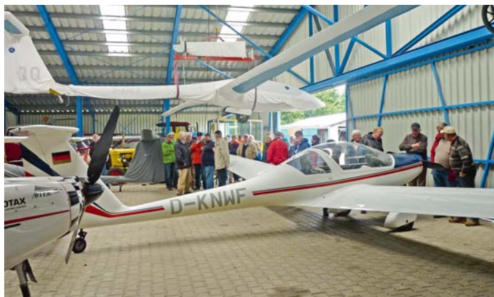
Besichtigung der Flurzeughalle in Quakenbrück.