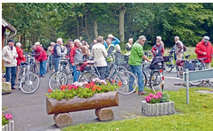
Rast in Langwege