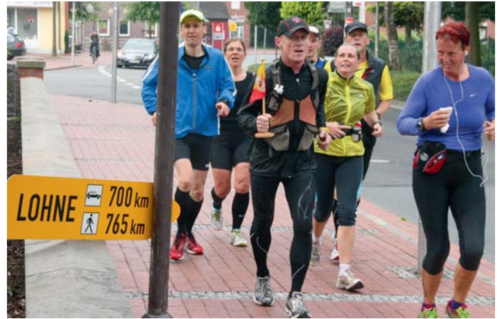
Ein sichtbares Zeichen setzten die Waldschleicher mit ihrem 120-Kilometerlauf durch den Landkreis Vechta. Wie hier in Langförden wurde immer wieder der Bezug zur Partnerstadt hergestellt. Zum einen begleitete der Wegweiser aus Rixheim nach Lohne die Gruppe. Zum anderen wurden die beiden Stadtfähnchen als symbolische Staffelstäbe mitgeführt.

Die verschiedenen Touren führen die Radfahrer im Süden bis zum Dümmer und im Norden bis Endel/ Varnhorn. Bei den RTF Touren kommt es nicht auf die gefahrene Zeit an, man sollte aber trotzdem über eine gute Kondition verfügen. Ebenfalls ist es ratsam mit einem Rennrad an den Start zu gehen. Auch hier sind alle