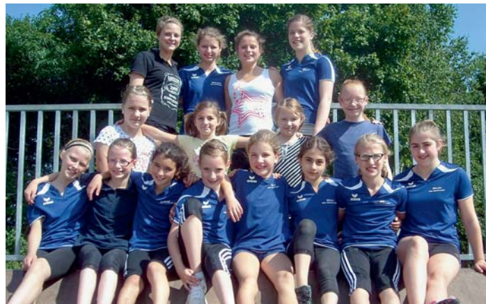
Vorbereitung für die Leichtathletik.

Gut gewappnet werden die Qualifizierten zu den Landesmeisterschaften in Osnabrück fahren.