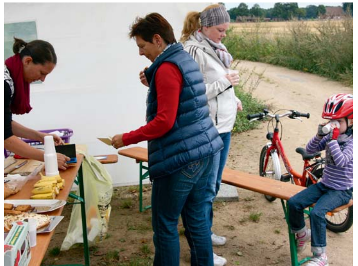
Stärkung muss sein! Dank der Fürsorge vieler Helfer konnten an den Kontrollpunkten abgefahrte Energien locker ersetzt werden.