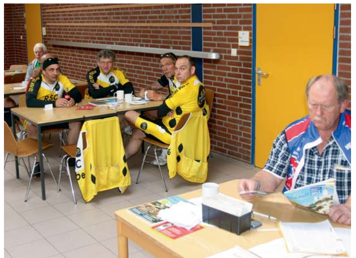
Auch im Ziel, die RTF-Fahrer hatten zumindest 45 Kilometer in den Beinen und kamen dennoch alle bester Laune bei Start und Ziel in der Ketteler-Schule an.