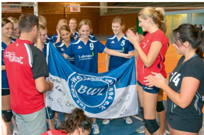
Wiedersehen macht Freude! Vor zwei Jahren spielten die Lohner Volleyballerinnen in Rixheim auf. Jetzt kommt eine Gruppe des ASE Rixheim zum Gegenbesuch nach Lohne