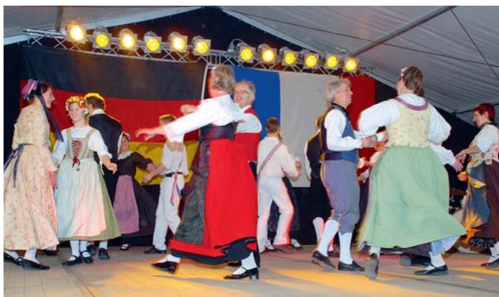
Fast schon Dauergäste sind die Mitglieder der Rixheimer Volkstanzgruppe Sundgauvia. Das Spitzenensemble wird am Samstag Bürgermeister Tobias Gerdesmeyer anmutig bei der offiziellen Eröffnung des Stadtfestes unterstützen.