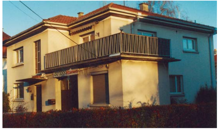
Zu klein war diese erste Dépendance der Firma Pöppelmann im Elsass, so dass ein Umzug nach Rixheim geplant wurde. Letztlich ein Glücksfall auch für die Geschichte der beiden Städte.