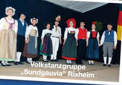
Volkstanzgruppe „Sundgauvia“ Rixheim