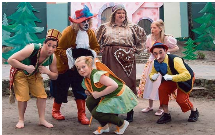
Ausschnitt aus dem Kinder-Musical „Rabatz im Zauberswald“, das ebenfalls einen ausgesprochen guten Besuch aufzuweisen hatte

Letzte Gelegenheiten für die Freilichtbühnenfreunde: Am 05.; 07.; und 08. September, wird jeweils um 20.00 Uhr noch „Funny Money“ über die Naturbühne gehen! Allen, die dieses Stück noch nicht gesehen haben, wird dringend ein Besuch auf der herrlichen Bühne am Rande des Stadtparks empfohlen. Erstklassige spielerische Leistungen und ein Stück, dass durch sein Tempo und Witz, seine Verwechslungen und Irritationen, besticht. Und noch etwas: Sollte der Wettergott nicht mitspielen, die tolle Membrane schützt vor Regen und Wind! Also: Hingehen!