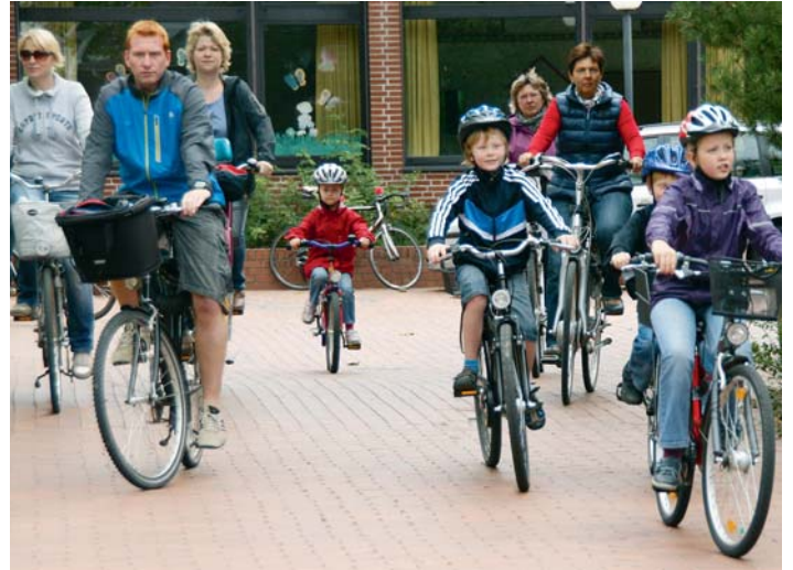
Volksradfahren der RSG Lohne-Vechta als Familienausflug! Da macht sportliche Betätigung gleich doppelt Spaß.

regnen begann, verzichteten andere wohl auf einen Start.“ Wie dem auch sei, keiner der teilgenommen hatte, bereute dieses Engagement und besonders freute sich die RRG Osnabrück, denn als stärkste teilnehmende Gruppe nahm sie einen Gutschein des Sponsors „Markant Markt“ mit nach Hause.