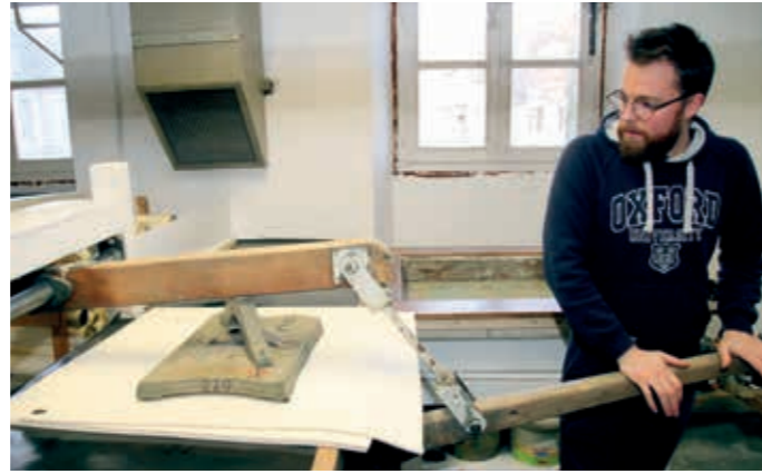
Tapetendruck heute: Ein Mitarbeiter der Firma Zuber & Co. führt das vor, was ab dem 10. April in Lohne zu sehen sein wird