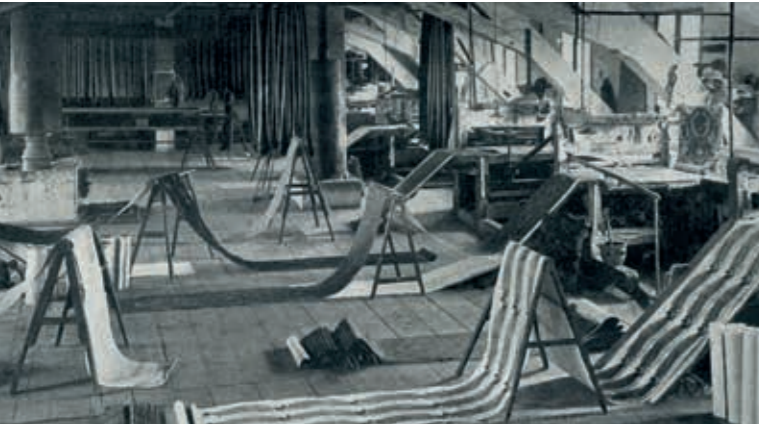
Tapetendruck um 1900. Die Techniken sind fast gleich geblieben in der Manufaktur Zuber & Co. Ab dem 10. April werden sie im Industrie Museum Lohne gezeigt