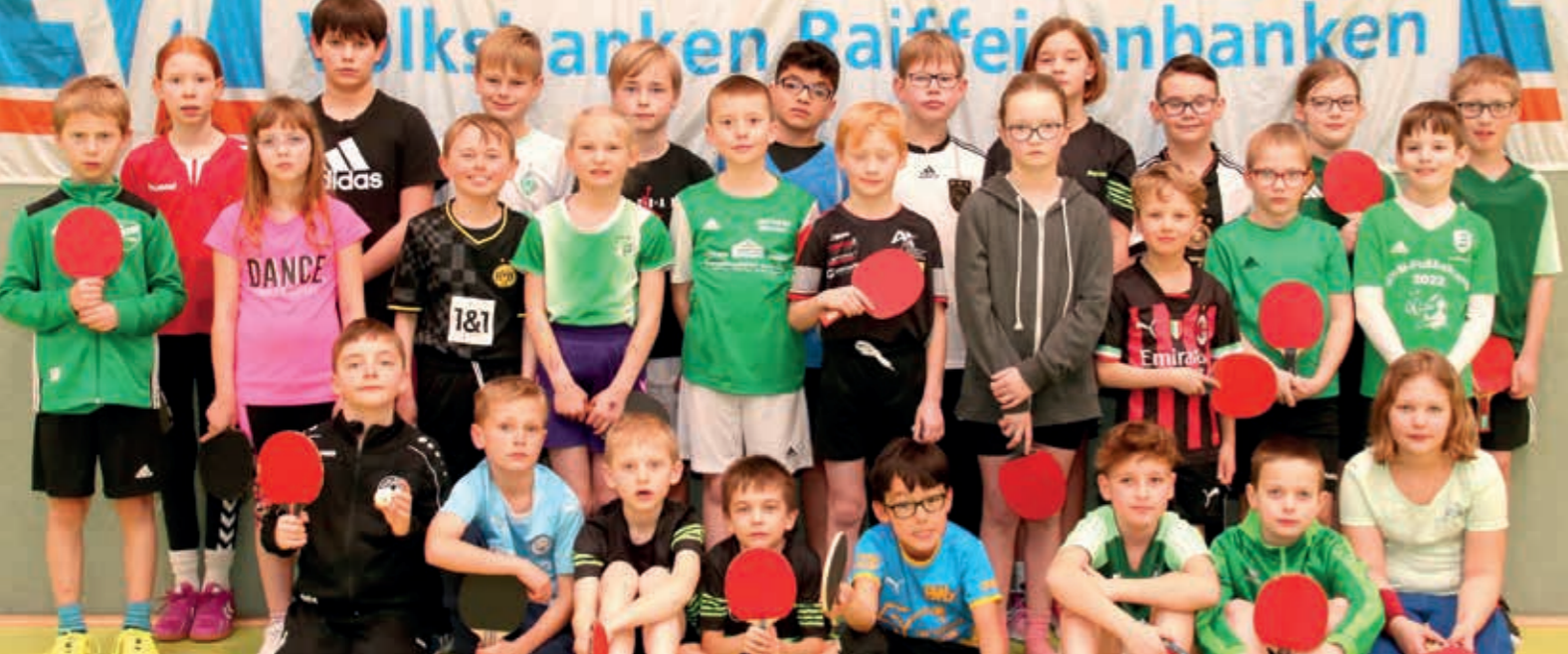
Den Großteil der Teilnehmer beim 41. Tischtennis-Kreisfinale der Minis stellten in Lohne die Vereine GW Mühlen, GW Brockdorf und BW Lohne.